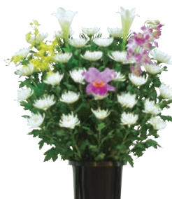
生花 1基 24,200円