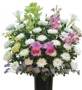
生花 1基 30,250円