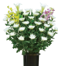
生花 1基 18,150円