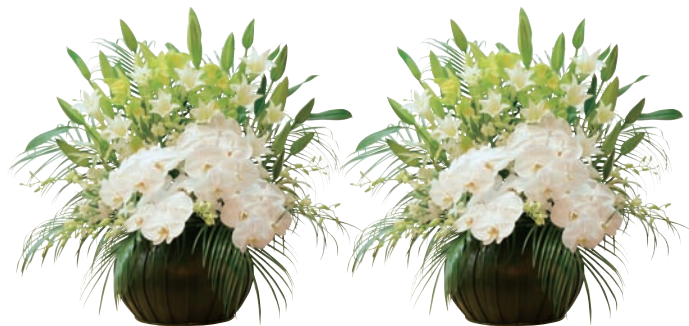
喪主花 1対 66,000円