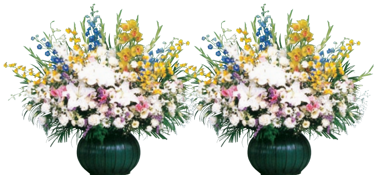
喪主花 1対 66,000円