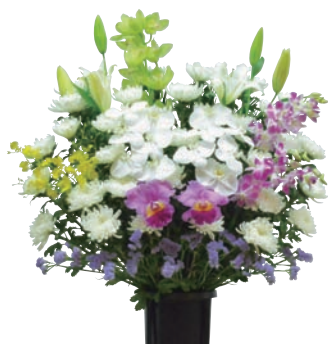
生花 1基 36,300円