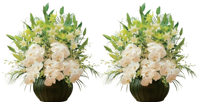
喪主花 1対 77,000円