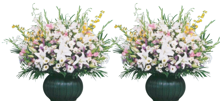
喪主花 1対 55,000円